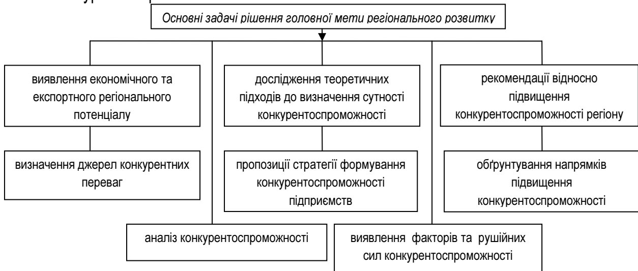
Малюнок 2. Основні завдання розв'язання головної мети регіонального розвитку.

При розгляді даної проблеми, соціально-економічний потенціал території служить як: