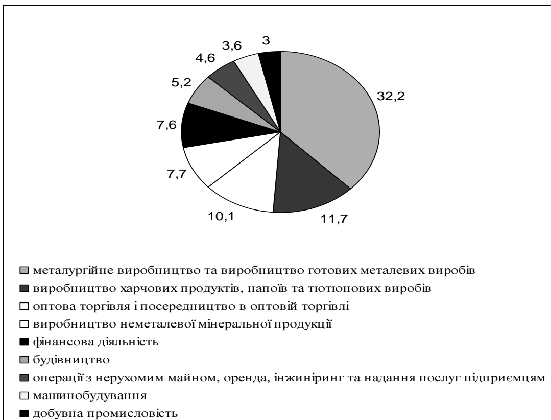
Рис. 1. Найбільш інвестиційно привабливі види економічної діяльності в Донецькому регіоні , %

Найбільш інвестиційно привабливими в регіоні у попередньому році виявились такі види економічної діяльності, як металургійне виробництво та виробництво готових металевих виробів, в яке надійшло 32,2% від загального обсягу інвестицій, виробництво харчових продуктів, напоїв та тютюнових виробів (11,7%), оптова торгівля і посередництво в оптовій торгівлі (10,1%). Серед інших видів економічної діяльності, на розвиток яких залучається іноземний капітал, виділяються виробництво неметалевої мінеральної продукції (7,7%), фінансова діяльність (7,6%), будівництво (5,2%), операції з нерухомим майном, оренда, інжиніринг та надання послуг підприємцям (4,6%), машинобудування (3,6%), добувна промисловість (3%) [9].